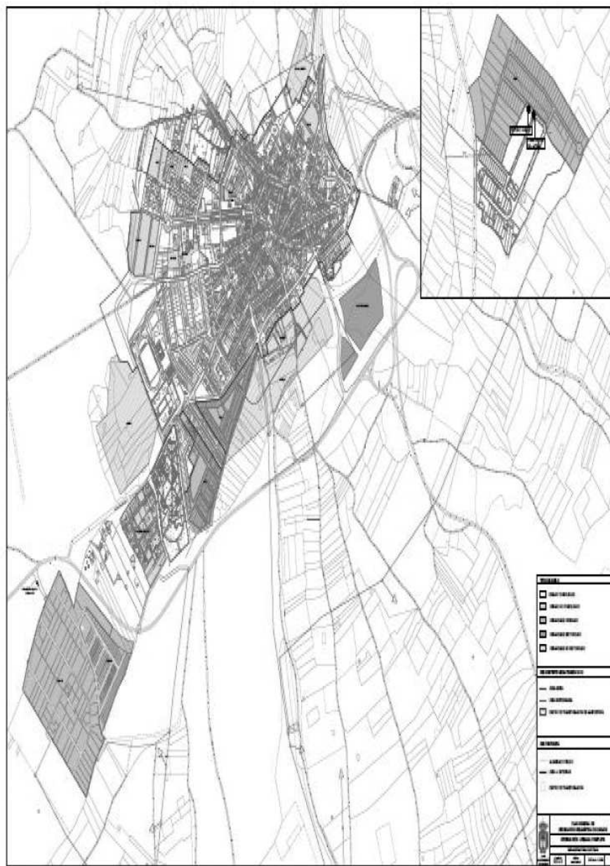
PLANOS DE ORDENACION