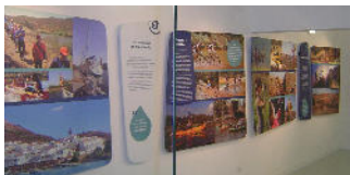
Sala de la Naturaleza