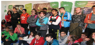
Sala Turismo Activo