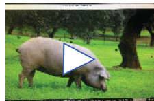
Video Promocional Cerdo Ibérico