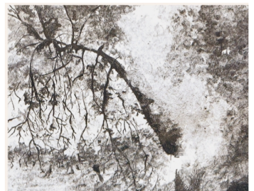
FÉLIX DE CARDENAS Olivo (detalle) . Aguafuerte