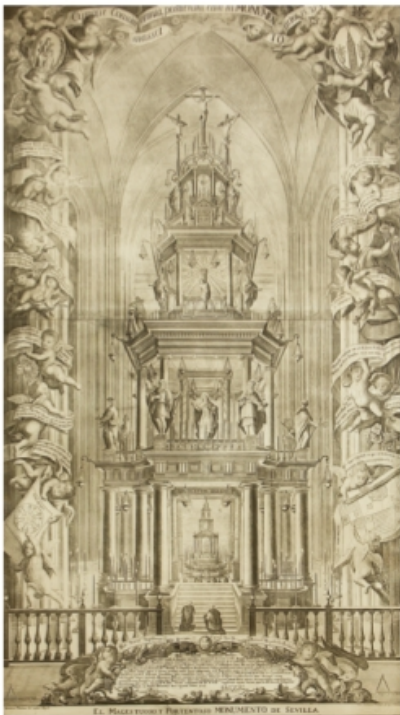
DOMINGO MARTÍNEZ El magestuoso y portentoso Monumento de Sevilla , 1737. Grabado al buril sobre cobre