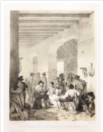
JOSÉ BÉCQUER Ladrones en una venta , c. 1841. Litografía