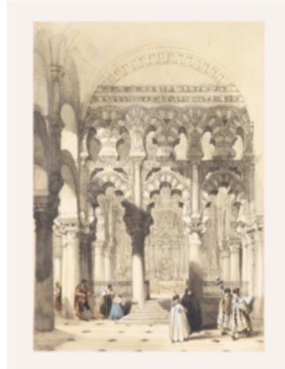
DAVID ROBERTS Interior de la Mezquita de Córdoba , 1837. Litografía