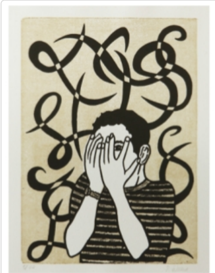
PATRICIO CABRERA Las tentaciones del eremita . Aguafinta sobre cobre