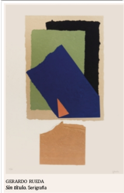
GERARDO RUEDA Sin título . Serigrafía