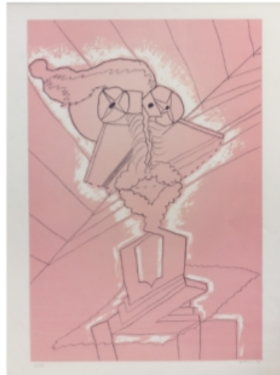
LUIS GORDILLO Personaje en rosa , 1977. Serigrafía