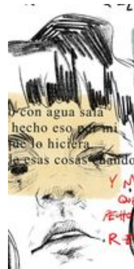
3. "La sal quita lo malo" (2021). Instalación digital. 60x40 cm.