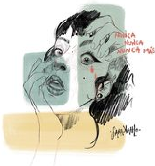
1. "Autosabotaje" (2021). Instalación digital. 60x40 cm.